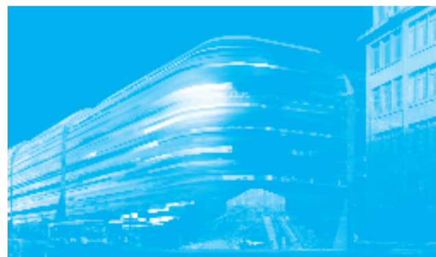
Le projet de l'agence Métra.

Depuis cent vingt ans, le quartier de Maraîchers Philidor est marqué par l'empreinte du transport public ; un atelier du métro, un dépôt d'autobus, des établissements tertiaires RATP, c'est au total plus de mille salariés qui travaillent quotidiennement dans le secteur et contribuent à la vie du quartier. D'un peu plus d'un hectare, la parcelle du centre bus dit de « Lagny » abrite un remisage d'autobus, un atelier de réparation et les locaux administratifs du centre bus.